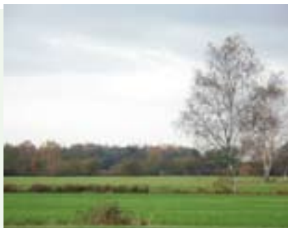
▲ Landschap van de veldpodzol in Brabant. Aan het voorkomen van berken zijn podzolen te herkennen.

Veldpodzolgronden zijn ontstaan in gebieden waar het water niet via een beek kon worden afgevoerd, maar ter plekke moest bezinken. Bij de ontginning is het gebied ontwaterd. Vaak zo sterk, dat er geen grondwater meer beschikbaar is voor het gewas. De humusinspoelingslaag is lang niet zo verdicht als bij de droge podzolgronden. Deze is bij de ontginning ook vaak geheel door de bovengrond heen gewerkt. Het is dan geen podzolgrond meer. De zwarte humus blijft echter aanwezig en maakt de grond onder natte omstandigheden kleverig en bij droogte gevoelig voor verstuiven. Ook is de ondergrond moeilijk doorwortelbaar. Op bodemkaarten staan deze diep bewerkte gronden vaak nog als podzolgrond aangegeven, hoewel dat strikt genomen niet meer het geval is.